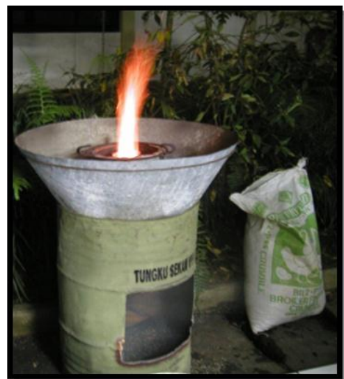
Gambar 2. Tungku sekam skala industri kecil.

Dalam pembuatan tungku sekam skala industri kecil ini berbeda ukurannya dengan tungku sekam skala rumah tangga. Untuk lubang pada badan tungku sekam skala industri kecil berukuran 40 x 68 cm seperti tampak dalam gambar 2.