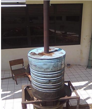
Gambar 3. Drum dengan cerobong boiler

Dalam penelitian ini menggunakan panci sebagai tempat memasak air berupa drum yang ditambahkan cerobong sebagai sistem boiler pada penelitian ini. Ukuran cerobong pada drum ini yaitu panjang 202 cm dan berdiameter 24 cm, seperti tampak dalam gambar 3.