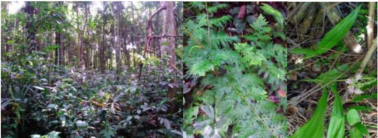
Gambar 2. Karakter kanopi lahan bera 15 tahun dan inset Selaginella spp. (kanan atas), dan Spathoglottis plicata (kanan bawah) yang berpotensi sebagai tanaman hias dan penyubur tanah

Berkaitan dengan aspek jenis yang berpotensi sebagai penyubur tanah terdapat Sellaginella spp., dan Bauhinia accuminata yang hadir pada lahan bera tersebut (Lampiran 1). Biomassa Sellaginella spp., khususnya serasah memiliki kandungan nitrogen yang tinggi yakni 42–101 g m -2 (Van Dyne dan Vogel, 1967). De Michelle et al. , (2012) menyatakan bahwa Sellaginella spp., memiliki gen AMT1 pengkode transport ammonium dan urea yang lebih efisien, sehingga mampu menyerap kadar N lebih tinggi dibanding tumbuhan berbunga. Bauhinia accuminata merupakan kelompok pemfiksasi N, karena merupakan salah satu jenis yang termasuk famili Leguminose dengan nodul pada akarnya. Bagaimanapun bentuk kontribusinya terhadap tanah, kedua jenis tersebut merupakan tumbuhan bawah non-kayu. Kunarso dan Azwar (2013) menyatakan bahwa tumbuhan bawah memiliki peran penting dalam konservasi tanah dan air.