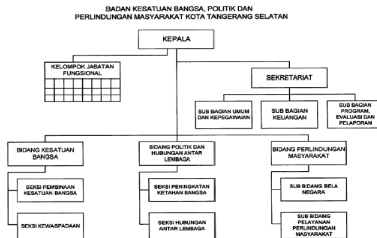
Gambar 1. Struktur Organisasi Kesbangpol Sebelum Perubahan