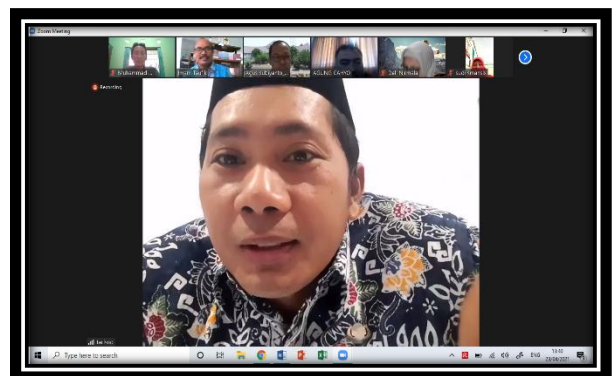
Diskusi dengan Peserta Pengabdian