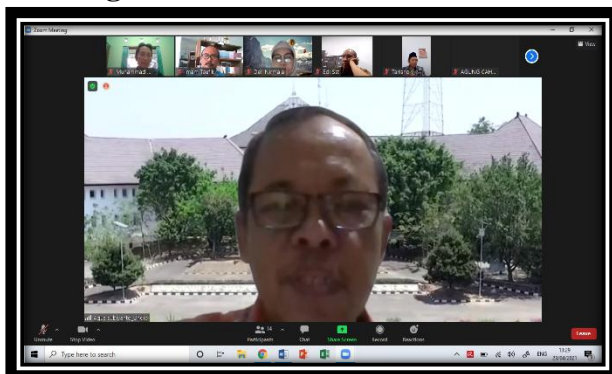
Ketua Prodi S2 Linguistik Membuka Kegiatan Pengabdian Masyarakat tahun 2021