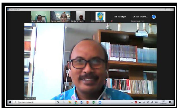
Peserta yang sedang mengikuti pelatihan