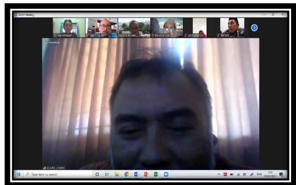
Diskusi dengan Peserta Pengabdian