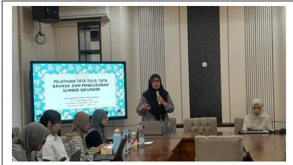
Gambar 1. Pidato Pembukaan oleh Koordinator

kegiatan pengabdian kepada masyarakat menjelaskan, bahwa alasan ini yang mendorong tim pengabdian kepada masyarakat untuk melaksanakan kegiatan pengabdian ini.