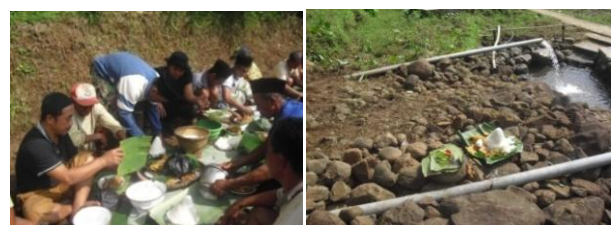
Gambar 3. Kegiatan Ritual di Tuk Serco