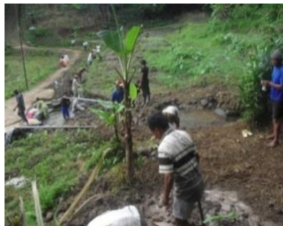
Gambar 2. Kerja bakti di Areal Tuk Serco

Kegiatan gotong-royong kebersihan Tuk Serco ini dilakukan secara rutin setiap bulan Maulud (Robiul awwal), pada hari Jum'at paing, dimulai jam 06.00 WIB. Kemudian dilanjutkan kegiatan ritual selamatan/sedekah dan sesaji.