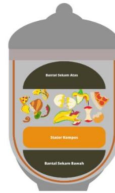
Gambar 3. Metode Takakura

Metode Takakura merupakan metode pengomposan yang sudah banyak diterapkan. Metode ini memakai bahan dasar organik limbah makanan atau limbah kebun yang mampu terdekomposisi dalam waktu 2 minggu dengan media pengurai untuk menjadi kompos (Al-khadher et al., 2021). Takakura yaitu cara pengomposan praktis karena tidak membutuhkan tempat yang luas (Dewilda et al., 2021) dan mempertimbangkan mikroorganisme yang terkandung, udara, dan kelembaban pada kompos (Hibino et al., 2020). Metode ini memakai lubang sebagai jalan keluar masuknya udara, sehingga hal tersebut tidak jarang menjadikan proses kompos nya membutuhkan waktu lama dengan bergantung cuaca (Ruslinda et al., 2021). Wadah penggunaan metode ini biasanya yaitu kotak kecil yang telah mengandung substrat fermentasi (Jiménez-Antillón et al., 2018), karena metode ini melalui proses secara aerobik dimana udara merupakan hal penting. Udara berperan sebagai asupan untuk proses pertumbuhan mikroorganisme pengurai (Wikurendra et al., 2022). Substrat yang dihasilkan oleh Takakura juga lebih efisien untuk mengurangi volume residu (Jiménez-Antillón et al., 2018). Peletakkan kompos metode Takakura ada pada Gambar 3.