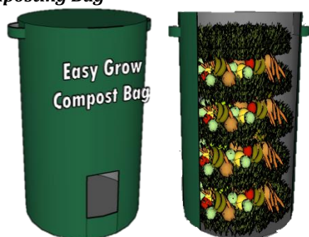
Gambar 4. Composting Bag

Composting Bag merupakan sebuah wadah kompos berbahan dasar material UV Resistant yang fleksibel. Gambar 4 merupakan gambar mengenai bentuk Composting Bag. Wadah ini sangat cocok untuk melakukan kompos pada area yang kecil atau sempit dan dapat dipakai berkali-kali. Banyak peneliti menyatakan penggunaan sistem pengomposan secara intensif tertutup pada jenis pengomposan di dalam ruangan memberikan dampak lebih ramah lingkungan dan murah. Hal tersebut diperkuat karena selama proses pengomposan tidak menghasilkan bau busuk serta mudah untuk di panen (Yuquan Wei et al., 2021).