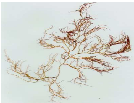
Gambar 2. Morfologi Gracilaria verrucosa.

Rumput laut Gracilaria , merupakan salah satu jenis alga merah yang banyak mengandung gel, dimana gel ini memiliki kemampuan mengikat air yang cukup tinggi. Untuk