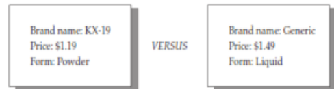
Gambar 2. Contoh metode dalam melakukan presentasi dalam Conjoint Analysis (Hair, dkk, 2014)