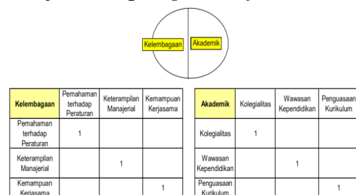
Gambar 2 Borang Pembobotan dari Manajemen Perguruan Tinggi

Pembobotan pada hierarkhi yang dilakukan seorang individu bisa berakibat hasil yang berbeda dengan individu lainnya. Dalam pengambilan keputusan kelompok dan resolusi konflik, Saatnya [7] mengetengahkan agar perbedaan antar individu dalam pembobotan / penilaian terlebih dahulu dicarikan kompromi yang bisa diterima semua pihak dimana pencapaian kompromi bisa dilakukan secara deterministik, statistik, atau mempertimbangkan gain benefit and cost .