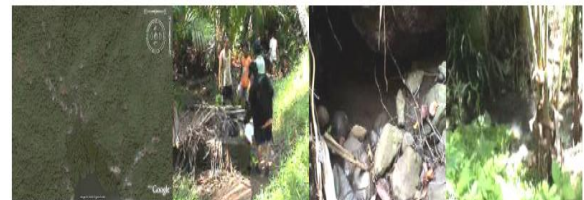
Gambar 3 Desa Behongan dusun Sowang dan sumber air

Masyarakat di Desa Behongan dusun Sowang mendapatkan air bagi kebutuhan hidupnya dari tampungan air hujan yang berada disamping rumah masyarakat dan sumur-sumur dangkal dan mata air yang berada dipebukitan yang diberi nama mata air kele'e dengan posisi N : 3o 10' 7,1" ; E : 125o 32' 9,8". Beberapa sumur yang menurut informasi masyarakat tidak pernah kehabisan air walau musim kering. Yang pertama dengan koordinat N : 3o 9' 51,4" ; E : 125o 32' 51,4" , yang kemudian ada juga sumur berdekatan namun hanya digunakan untuk cuci, dan N : 3o 9' 53,8" ; E : 125o 32' 4,9" yang digunakan untuk minum dan cuci. Tempat lain yang terdapat sumber air yang mengalir terletak diwilayah yang dinamai Lewa'e dimana pada lokasi ini direncanakan akan dijadikan lokasi perumahan. Sumber air berada pada N : 3o 10' 5,1" ; E : 125o 31' 6,3" berada pada dataran rendah pada catchment area yang berbeda baik untuk dusun Soa maupun untuk dusun Sowang serta memiliki jarak ± 1,5 km.