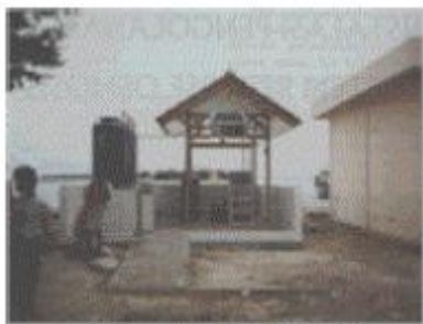
Gambar 9 IPA-RO