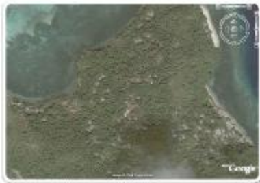
Gambar 5 Dusun Bombanehe

Pada Desa Dalako-Bembanehe dusun Bombanehe dengan koordinat N : 3o 10' 50,7" ; E : 125o 30' 34,0" terdapat sumur yang dibuat oleh penduduk bertempat dipinggiran pantai (Gambar 15), dan juga pada daerah yang dinamai Memaneke/Akuriang dengan posisi N : 3o 11' 6,5" ; E : 125o 30' 32,3" terdapat sumur yang dibangun oleh masyarakat dengan dua ruang, dimana ruang yang arah laut untuk mencegah intrusi air laut jika dalam keadaan pasang agar pada ruang yang kedua tidak tercampur air laut/payau