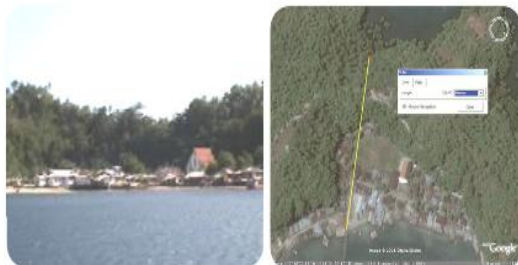
Gambar 2 Desa Behongan dusun Soa

Dalam memenuhi kebutuhan air masyarakat diperoleh dari tampungan air hujan yang berada disamping rumah masyarakat dan sumur-sumur dangkal