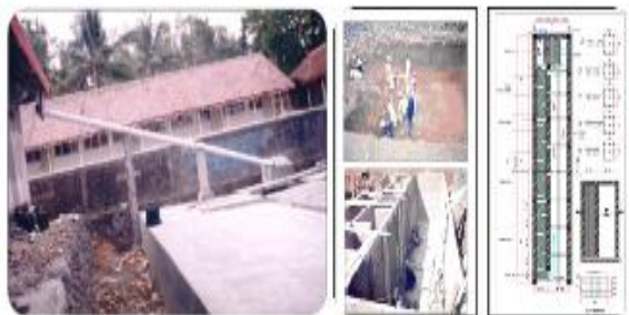
Gambar 8 ABSAH