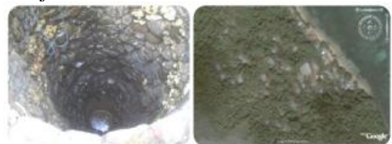
Gambar 4 Dalako dan sumber air

Pada dusun Bombanehe terdapat sumur dalam yang digali oleh masyarakat namun hanya memiliki debit yang sangat kecil. Sehingga sebagian besar sumber air yang ada dengan tampungan air hujan.