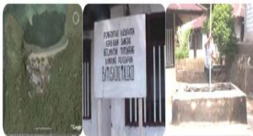
Gambar 6 Batusaiki dan sumber air

Desa Batusaiki Taleko dusun Batusaiki. Di Dusun Batusaiki, menurut masyarakat jumlah air mencukupi sehingga pada musim kering masyarakat dari Pulau lainnya seperti Kalama dan Mahangetang sering datang mengambil air di tempat.