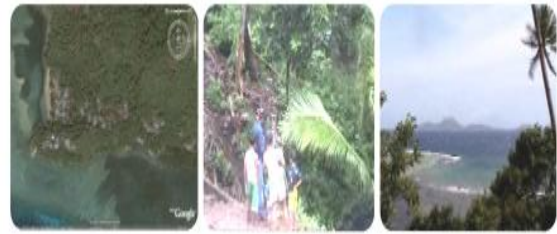
Gambar 7 Taleko

Batusaiki dengan perahu dan mengangkutnya kerumah masing-masing.