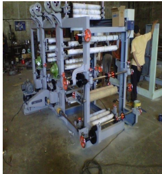
Gambar 1 Produk CV XYZ : Mesin Printing

Objek penelitian ini adalah CV. XYZ, merupakan perusahaan yang bergerak di bidang manufaktur sebagai general supplier mesin-mesin cetak yang menggunakan mesin lama seperti yang disajikan pada Gambar 1.