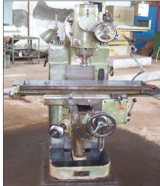
Gambar 2 Mesin Frais