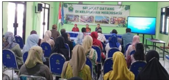
Gambar 2. Sosialisasi verifikasi STBM di Kelurahan Merjosari

Faktor komunikasi dapat digambarkan sebagaimana pernyataan Tenaga Sanitarian Puskesmas Dinoyo Kota Malang berikut: “...untuk saat ini hampir beberapa orang sudah paham STBM, maksudnya dari yang tidak mau membangun septic tank, akhirnya mereka mau. Untuk medianya itu masih sosialisasi saja, masih tatap muka saja. Biasanya yang di undang itu kelurahan, kemudian RW, kemudian kota sehat kemudian kader. Sudah itu saja. Itu saja. LPMK kita undang. PKK tidak. Karang taruna tidak di undang karena masih sekolah. pak RT biasanya kita undang, meskipun tidak seluruhnya, tapi perwakilan. Karena kan sasarannya per RT. Kalo secara pemahaman mereka setengah paham setengah tidak. Makanya kita tiap tahun melakukan sosialisasi dan pendampingan, setahun dua kali” (IK1).