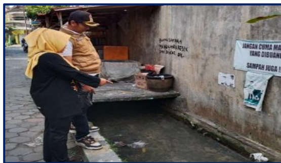
Gambar 3. Saluran pembuangan tinja dari rumah

Sebaran data pada Tabel 2 juga diperkuat hasil wawancara dengan Ketua Pokja Sehat Kelurahan Merjosari bahwa faktor tingginya pembuangan tinja ke sungai karena letak geografis Kelurahan Merjosari yang di lewati Sungai Metro. “Sulitnya karena wilayah merjosari dilewati sungai metro, RW 5, RW 6, RW 12. Biasanya langsung dialirkan ke sungai . Atau yang di wilayah RW 2 bisanya dialirkan melalui saluran yang muaranya menuju ke Sungai Metro. Jadi masih banyak rumah yang pembuangannya langsung ke sungai”. (IK 5).