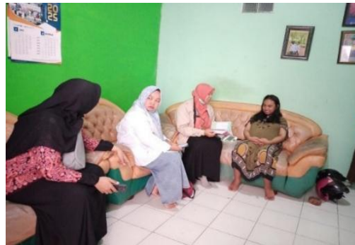
Gambar 4. Lembaga Kemasyarakatan melakukan verifikasi STBM di salah satu rumah warga

RW yang menggerakkan Masyarakat. Jadi kita ini meminta bantuan supaya Pak RT, Pak RW untuk menggerakkan masyarakatnya dalam implementasi STBM” (IK 3).