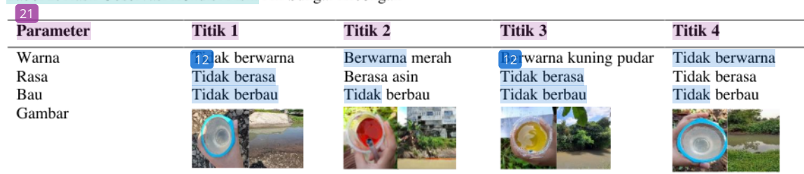
Tabel 2. Hasil Observasi Kondisi Fisik Air Sungai Kreongan

Berdasarkan tabel 2 didapatkan hasil bahwa kondisi fisik air Sungai Kreongan pada titik 1 dan 4 cenderung sama yakni tidak berwarna, tidak berasa dan tidak berbau. titik pembuangan limbah batik. Sedangkan kondisi fisik air Sungai Kreongan pada titik 2 yang merupakan titik point source limbah batik x yakni berwarna merah pada bagian pinggir aliran sungai, berasa asin namun tidak berbau. Warna merah disebabkan dari buangan limbah batik yang mengandung zat warna merah. Hal ini sejalan dengan penelitian Kirana (2021:5) bahwa air Sungai Citarum mengalami perubahan warna menjadi biru akibat buangan limbah pabrik batik yang ada disekitarnya (13) . Warna pada air disebabkan dari adanya bahan kimia atau mikroorganisme yang terlarut dalam air. Warna yang disebabkan dari bahan-bahan kimia disebut apparent color yang berbahaya bagi tubuh manusia (14) .