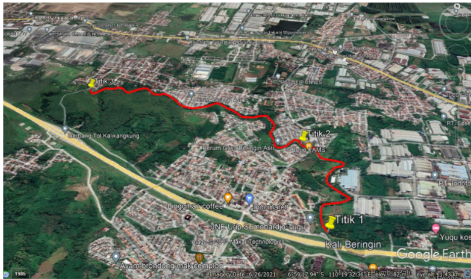
Gambar 1. Peta Lokasi Pengambilan Sampel di DAS Beringin