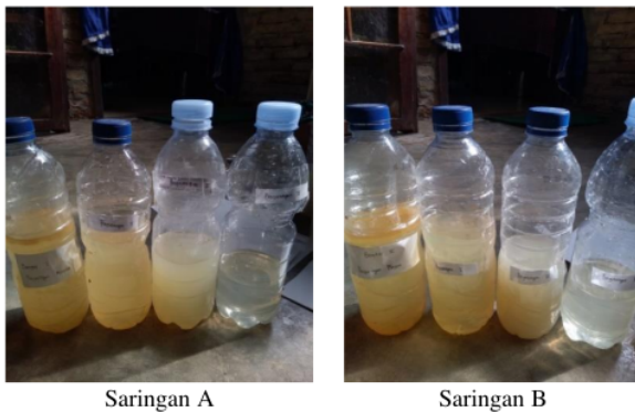
Gambar 1. Perbedaan Hasil Saringan A dan Saringan B Dalam Menyaring Minyak Pada Air Limbah

Uji kandungan minyak pada penelitian ini dilakukan secara organoleptik di mana kandungan minyak pada kontrol masih tinggi (sebelum penyaringan). Namun setelah dilakukan 3 kali penyaringan maka kandungan minyak pada air cuci tangan (29) berkurang dan apabila disentuh dengan tangan sudah terasa kesat. Dapat disimpulkan filtrasi ini mampu menurunkan kadar BOD, COD, TSS dan fosfat pada satu kali penyaringan.