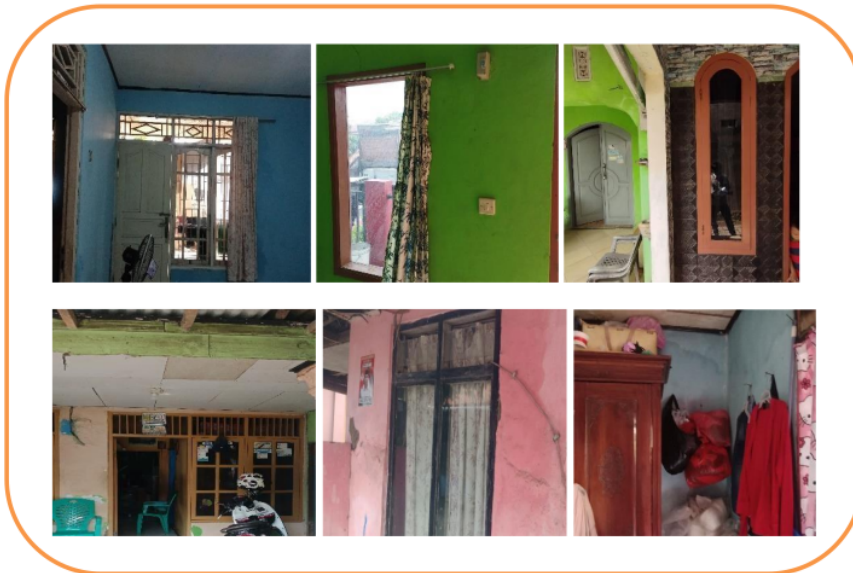
Gambar 1 Kondisi Lingkungan Rumah Responden di Area Bandara X

Berikut gambaran kondisi saat pengukuran kondisi dan kualitas lingkungan rumah responden di sekitar area Bandara X :