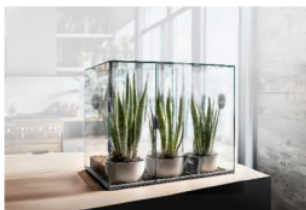
Gambar 1. Grup Eksperimen