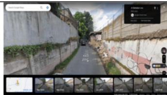
Gambar 6. Jalan Sekitar TPS RW 06 Pasir Kaliki.