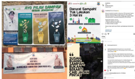
Gambar 1. Media Edukasi Literasi Sampah