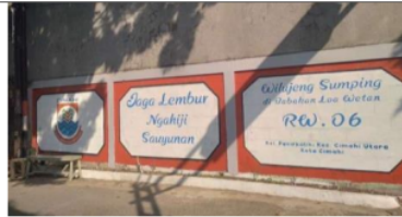
Gambar 3. Lingkungan Sekitar Gapura Dekat TPS RW 06 Pasir Kaliki.