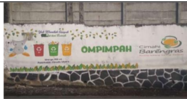
Gambar 7. Jalan Sekitar TPS RW 06 Pasir Kaliki.

Peningkatan literasi sampah pada masyarakat adalah upaya dalam mengubah perilaku sosial dan budaya masyarakat. Adapun dalam perubahan sosial terjadi karena beberapa proses yang dilalui, diantaranya (1) penyebaran informasi; (2) modal; (3) teknologi; (4) ideologi; (5) birokrasi; (6) agen atau aktor. 35 Edukasi literasi sampah membentuk pola pikir dan kebiasaan masyarakat sesuai dengan tujuan menciptakan lingkungan yang lebih baik. Dalam komponen literasi lingkungan, aspek pengetahuan seperti pengetahuan ekologi, sosial-politik, dan isu lingkungan sangat diperlukan untuk membangkitkan kepekaan dan kebiasaan yang bertanggung jawab terhadap lingkungan. 36 Namun, pengetahuan saja pun tidak cukup untuk meningkatkan literasi sampah. 21 Pengembangan literasi sampah masyarakat perlu didukung oleh sistem masyarakat yang mengelola sampah secara berkelanjutan. Penyampaian informasi dan edukasi terkait sampah perlu terus digaungkan terutama aktor perubahan atau pihak yang berwenang. Edukasi perlu dibarengi dengan penerapan kebijakan serta aturan yang tegas dan kontinu guna menanamkan budaya literasi sampah di masyarakat.