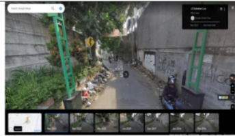
Gambar 2. Lingkungan Sekitar Gapura Dekat TPS RW 06 Pasir Kaliki.