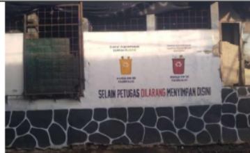
Gambar 5. TPS RW 06 Pasir Kaliki.