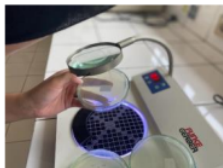
Gambar 4. Analisis Jumlah Aneka