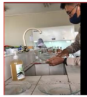
Gambar 2. Proses Pencucian