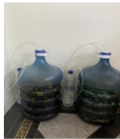
Gambar 1. Proses

Larutan eco enzyme yang sudah matang tersebut kemudian dibuat dalam bentuk sabun cair antimikroba yang diujikan pada sampel. Larutan eco enzyme dalam bentuk sabun cair digunakan sebagai perlakuan untuk mencuci sampel sebanyak 8 kali pengulangan untuk masing-masing perlakuan. Pre test dilakukan pada sampel yang sama tanpa menggunakan larutan eco enzyme . Pengumpulan data secara deskriptif diperoleh dengan cara menganalisis karakteristik larutan eco enzyme yang sudah matang yang terdiri dari warna, aroma dan pH selanjutnya diteliti melalui pemeriksaan laboratorium dengan cara melakukan perhitungan angka kuman Pre dan Post test pada sampel. Data diperoleh secara analisis univariat dan bivariat. Analisis univariat diperoleh secara deskriptif yaitu data angka koloni atau mikroba menggunakan metode Standr Plate Count (SPC) merupakan metode yang digunakan untuk mendapatkan hasil hitung mikroba dengan batasan jumlah mikroba yang dihitung yaitu 30-300CFU/ml dari pengenceran 10^{-1} , 10^{-2} , 10^{-3} , 10^{-4} , 10^{-5} . Analisis bivariat digunakan untuk mengetahui penurunan angka kuman pada sampel Pre-Post menggunakan masing-masing perlakuan. Persyaratan angka kuman pada alat makan mengacu pada Permenkes RI No. 1096/Menkes/Per/VI/2011 tentang Higiene Sanitasi Jasa Boga yaitu angka kuman < 0 CFU/ cm 2