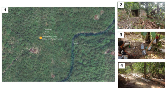
Gambar 2. Hasil Survei Lingkungan di Tempat Kerja Kasus (Lokasi Penebangan Kayu)

Kedua kasus bekerja sebagai penebang kayu di kawasan hutan desa. Aktivitas penebangan dilakukan di area hutan desa yang berada tidak jauh dari pemukiman. Berdasarkan hasil survei lingkungan ditemukan beberapa titik genangan air di lokasi penebangan. Selain itu makanan pada tempat istirahat di lokasi kerja hanya digantung di pohon tanpa ada penutup yang memadai. Lokasi kerja kasus yang berada di area hutan dan sepanjang aliran sungai memiliki karakteristik lingkungan lembap dan terbuka. Walaupun perangkap tikus di lokasi kerja tidak menghasilkan tangkapan namun pengakuan pekerja pernah melihat keberadaan tikus disana. Kondisi ini meningkatkan kemungkinan adanya kontaminasi lingkungan oleh urin hewan reservoir. Penelitian sebelumnya menegaskan bahwa risiko infeksi leptospirosis tidak selalu berbanding lurus dengan jumlah tikus yang tertangkap, tetapi sangat dipengaruhi oleh tingkat kontaminasi lingkungan dan perilaku kerja individu. 16,17