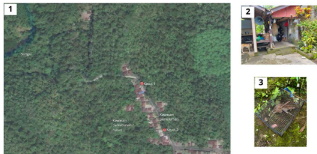
Gambar 1. Hasil Survei Lingkungan di Kawasan Pemukiman Kasus

Keterangan: 1) Pemetaan lingkungan rumah kasus dan wilayah sekitarnya; 2) Kondisi lingkungan rumah kasus; 3) Tikus yang ditangkap di kawasan pemukiman kasus