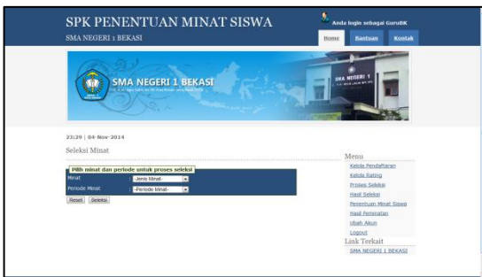
Gambar 10 Proses Seleksi

Gambar 9. Menampilkan halaman kelola rating. Halaman ini memiliki fitur untuk mengubah rating kriteria serta menambah, mengubah, dan menghapus rating alternatif.