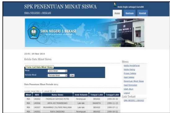
Gambar 12 Hasil Peminatan

Gambar 11 menampilkan halaman penentuan minat siswa. Pada halaman ini terdapat tabel hasil proses perhitungan TOPSIS. Penentuan dapat dilakukan dengan memilih periode minat.