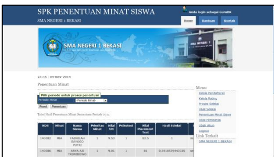
Gambar 11 Penentuan Minat Siswa

Gambar 10 menampilkan halaman proses seleksi. Pada halaman ini user memilih jenis dan periode minat yang ingin diproses.