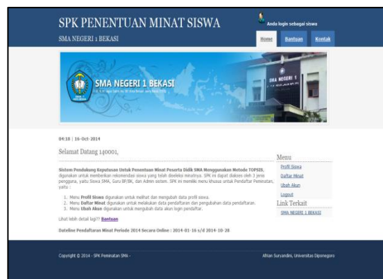
Gambar 14 Menu Utama Pendaftar

Gambar 14 menampilkan halaman menu utama administrator. Halaman ini adalah tampilan awal dari pengguna Pendaftar.