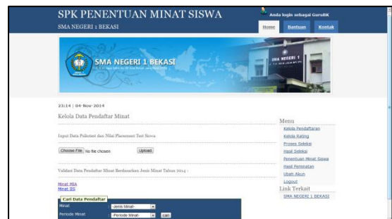
Gambar 8 KelolaData Pendaftar

Gambar 7 menampilkan halaman menu utama administrator. Halaman ini adalah tampilan awal dari pengguna Guru BK.