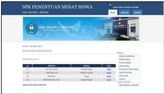
Gambar 9. Kelola Rating

Gambar 9. Menampilkan halaman kelola rating. Halaman ini memiliki fitur untuk mengubah rating kriteria serta menambah, mengubah, dan menghapus rating alternatif.