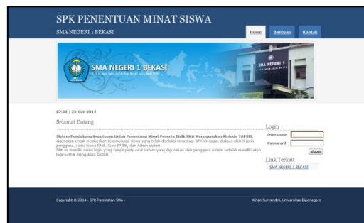
Gambar 2. Halaman Index