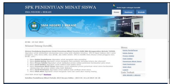
Gambar 7 Menu Utama Guru BK

Gambar 7 menampilkan halaman menu utama administrator. Halaman ini adalah tampilan awal dari pengguna Guru BK.