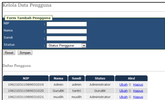
Gambar 4 Halaman Kelola Pengguna

Gambar 3 menampilkan halaman menu utama administrator. Halaman ini adalah tampilan awal dari pengguna Administrator.