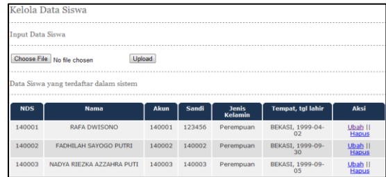
Gambar 6 Halaman Kelola Siswa

menambah, mengubah dan menghapus data minat.