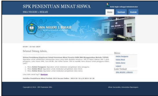
Gambar 3 Menu Utama Administrator

Gambar 3 menampilkan halaman menu utama administrator. Halaman ini adalah tampilan awal dari pengguna Administrator.