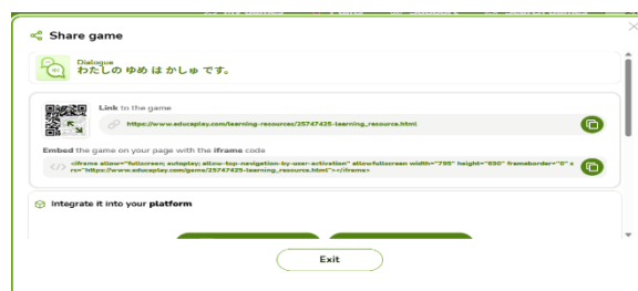
Gambar 11. Link barcode sudah siap untuk di share kepada siswa