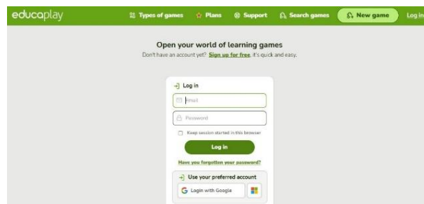
Gambar 3. Login dengan cara mengisi alamat email serta password untuk mendaftar