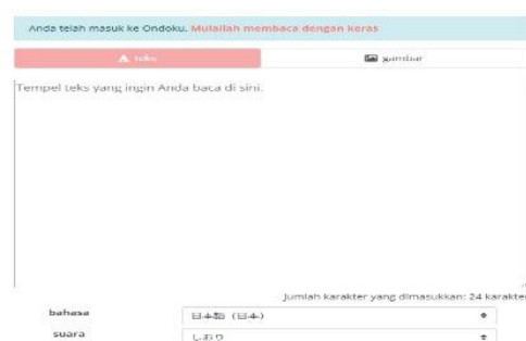
Gambar 7. Akan muncul tampilan seperti ini, ketikkan teks dalam bahasa jepang, kemudian pilih “ bahasa ” bahasa asing yang ingin digunakan dan pilih karakter “ suara ” yang akan digunakan