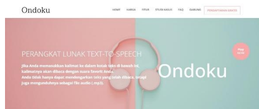
Gambar 6. Untuk mengisi suara pada aplikasi educaplay , dengan memanfaatkan aplikasi “ ondoku3 ”