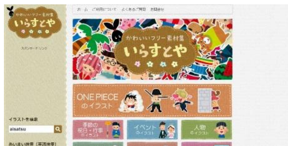
Gambar 5. Mencari karakter tokoh, dengan bantuan aplikasi “irasutoya”