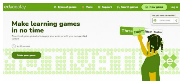
Gambar 1. Masuk pada link aplikasi educaplay.com