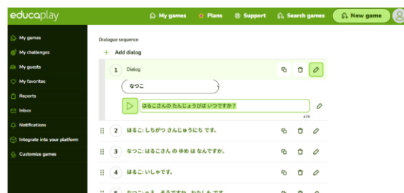
Gambar 9. Memasukkan teks, karakter gambar serta rekaman suara ondoku pada aplikasi educaplay