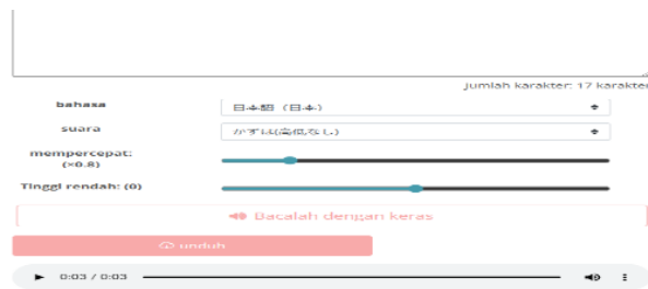
Gambar 8. Mengatur “ritme suara” dan “tinggi rendah”, kemudian klik “Bacalah dengan keras” untuk mengetahui kecepatan suara. Apabila sudah sesuai, silakan klik “unduh”