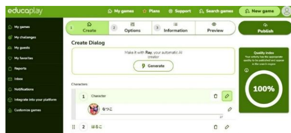
Gambar 10. Apabila “Quality indeks” sudah mencapai 100%. Kemudian klik “Publish”