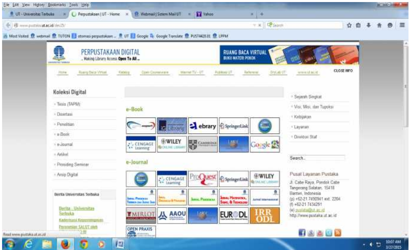
Gambar 1. Tampilan Laman Perpustakaan Digital Universitas Terbuka