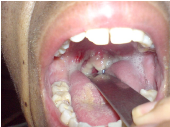
Gambar 3. Mukositis oral akibat induksi radioterapi

Hasil studi ini mirip dengan penelitian Mac Farlene yang mendapatkan bahwa penyebab utama mukositis oral adalah Candida albicans . 2 Selama radioterapi, kolonisasi Candida meningkat, sehingga berakibat munculnya mukositis (Gambar 3). Hasil tidak berbeda bermakna pada pemberian fluconazole sebagai anti fungi menunjukkan bahwa respon terapi hanya terjadi pada mukositis jamur. Mukositis terkait radioterapi secara patofisiologi diakibatkan efek radiasi langsung, berupa inflamasi, efek sitotoksik dan didukung pertumbuhan berlebihan dari mikroorganisme flora normal. 8