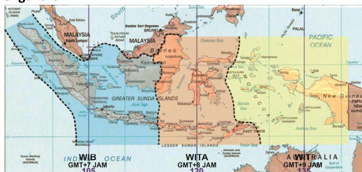
Gambar 02: Wilayah Pembagian Waktu di Indonesia

Sedangkan letak astronomis kota Semarang berada di sekitar 110° BT, ini berarti 110°-105° = 5° atau 5x4 menit = 20 menit lebih awal. Sehingga dapat diketahui waktu tengah hari sebenarnya di kota Semarang adalah 20 menit lebih awal, atau jam 11.40.