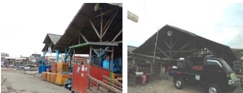
Gambar 8. TPI Tambak Lorok