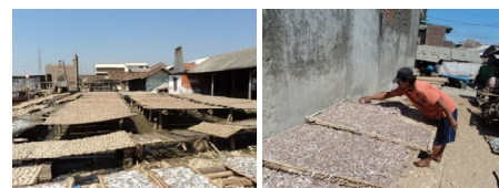
Gambar 11. Area Penjemuran Ikan Tambak Lorok

Dermaga pariwisata merupakan dermaga yang digunakan untuk pendaratan pengunjung yang ingin berwisata ke laut atau memancing. Biasanya pengunjung mendarat di dermaga ini lalu naik ke perahu dan jalan-jalan ke tengah laut dengan perahu. Dermaga ini terletak di ujung kampung Tambak Lorok dan hanya terdapat satu dermaga.