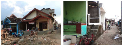
Gambar 2. Kondisi Rumah Permanen di Tambak Lorok

Kondisi Tambak Lorok yang kumuh di dominasi oleh penduduk yang bermata pencaharian sebagai buruh industri, buruh bangunan, pedagang, industri kecil, industry rumah tangga yang berkaitan dengan penangkapan ikan.