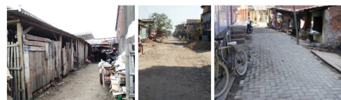
Gambar 3. Kondisi Jalan Lingkungan Tambak Lorok

Penerangan di Tambak Lorok cukup memadai. Terdapat beberapa jenis lampu yang ada disana. Lampu jalan di Tambak Lorok berasal dari bantuan pemerintah