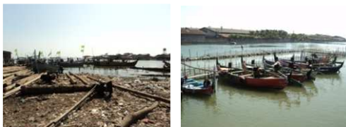
Gambar 9. Dermaga Perapatan Perahu Tambak Lorok

perapatan perahu nelayan biasa berada di tepian sungai sekitar TPI atau di Kali Banger. Terdapat beberapa nama dermaga seperti dermaga Nusantara, Gotong Royong, Karang Taruna. Nelayan mengkoordinasi sendiri siapa saja yang boleh merapatkan perahunya ke dermaga tertentu.