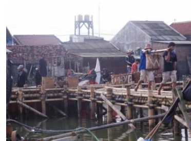
Gambar 10. Dermaga Pendaratan Ikan Tambak Lorok

Dermaga pariwisata merupakan dermaga yang digunakan untuk pendaratan pengunjung yang ingin berwisata ke laut atau memancing. Biasanya pengunjung mendarat di dermaga ini lalu naik ke perahu dan jalan-jalan ke tengah laut dengan perahu. Dermaga ini terletak di ujung kampung Tambak Lorok dan hanya terdapat satu dermaga.