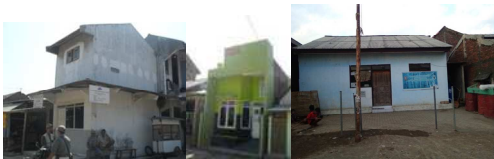
Gambar 7. Fasilitas Kesehatan Tambak Lorok