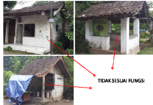
Gambar.6 Ruang Berkumpul

Ruang untuk berkumpul warga yang terdapat dikawasan Desa Borobudur ini banyak yang tidak dapat difungsikan lagi karena tidak dirawat lagi oleh masyarakat, selain tidak terawat fasilitas ini juga difungsikan lain sebagai tempat jualan dan juga tempat spanduk, padahal masyarakat masih sering mengadakan pertemuan-pertemuan, karena fasilitas ini tidak terawat maka pertemuan warga biasanya diadakan di rumah kepala dusun setempat. Sebaiknya fasilitas desa ini terus dirawat agar masyarakat masih memiliki tempat untuk berkumpul.