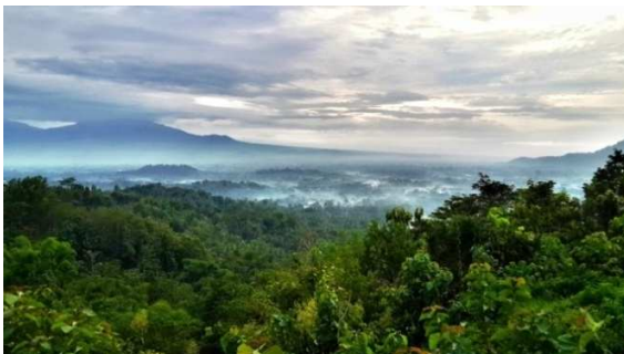
Gambar.2 Puthuk Setumbu

Punthuk Setumbu merupakan nama sebuah bukit yang terletak sekitar 4 km arah barat Candi Borobudur. Bukit yang terletak di Desa Karangrejo ini merupakan salah satu tempat terbaik untuk menyaksikan kemegahan Candi Borobudur di kala pagi. Namun indahnya pemandangan ini tidak dilengkapi dengan fasilitas yang memadai, ditunjukkan dengan sepanjang jalan menuju atas bukit yang cukup terjal tidak seluruhnya dilengkapi dengan reling tangan sebagai upaya pengamanan.