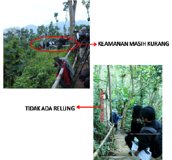
2. Gambar.3 Puthuk Setumbu

ini harusnya lebih ditingkatkan lagi agar kenyamanan pengunjung dapat tercapai.