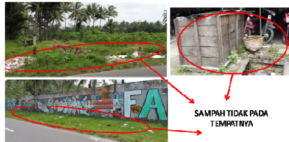
Gambar.7 Sampah

Persoalan sampah di desa Borobudur ini masih belum bisa ditangani dengan baik karena terlihat sendiri tumpukan sampah berada tepat dipinggir jalan yang merupakan salah satu akses menuju ke wisata candi borobudur, hal tersebut sangat tidak enak dipandang oleh mata. Tidak hanya itu sampah pada selokan pun dibiarkan menumpuk tanpa adanya pengolahan sampah. Akibat menumpuknya sampah ini maka keindahan suasana desa borobudur terganggu oleh adanya banyak tumpukan sampah ini dan juga dapat mempengaruhi kenyamanan pembauan