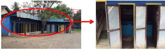
Gambar 5 Kamar Mandi Umum

Kamar mandi umum ini adalah kamar mandi yang berada di sekitar gerbang borobudur, keadaan kamar mandi ini sangat tidak memadai dan tidak terawat. Sehingga jarang sekali wisatawan yang menggunakan kamar mandi ini, padahal kamar mandi ini sangat diperlukan sebagai penambah fasilitas pariwisata dengan jumlah pengunjung yang sangat banyak.