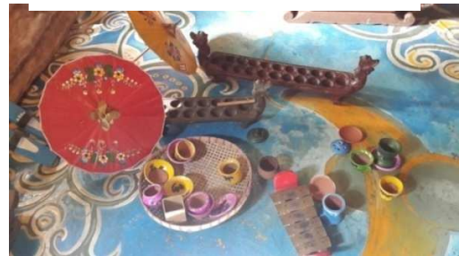
Gambar.4 Kampung Dolanan Nusantara

Kampung dolanan nusantara ini berada di Dusun Sodongan, Desa Bumiharjo, Kecamatan Borobudur, Kabupaten Magelang. Kampung dolanan nusantara ini merupakan salah satu pilihan wisata dalam kawasan wisata borobudur, dalam kampung dolanan nusantara ini terdapat berbagai macam maianan-mainan tradisonal Indonesia tempo dulu. Diantanya adalah congklak, wayang, gangsing, engrang, dll. Namun yang masih kurang pada tempat ini adalah kurangnya sinagse dan keterangan yang menunjukkan jalan ke lokasi sehingga para