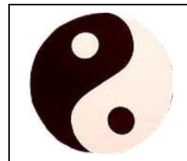
Gbr.7.Simbol Keseimbangan Yin & Yang