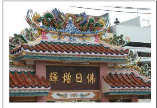
Gbr.9. Contoh Ornamen Atap Klenteng Cina.