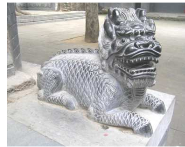
Gbr.3. Arca Hewan Qilin

Qilin adalah hewan mistik masyarakat Cina yang melambangkan nasib baik, kebesaran hati, panjang umur serta kebijaksanaan. Hewan ini sering digambarkan memiliki kepala naga berbadan rusa, surai dan ekor seperti harimau, serta memiliki 5 warna.