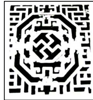
Gbr.6. Contoh Bentuk Geometri

tertentu, melainkan hanya merupakan permainan pola tertentu.