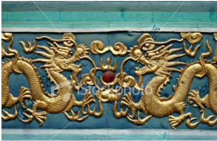
Gbr.1. Contoh Relief Naga