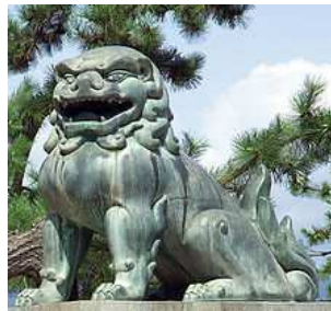
Gbr.2. Arca Singa

Hewan jenis ini banyak diwujudkan dalam bentuk arca batu yang biasanya sepasang yaitu jantan dan betina. Singa melambangkan keadilan dan kejujuran hati. Bentuk singa ini lebih meyerupai anjing Pekingese.