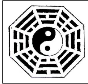
Gbr.8. Simbol Pat Kwa

Simbol-simbol ini dipercaya dapat menolak pengaruh hawa jahat dan mendatangkan kemakmuran serta keselamatan.