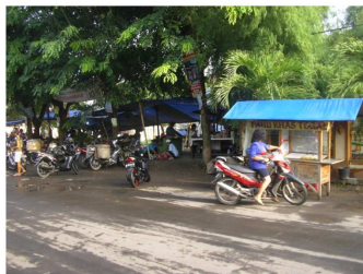
Gambar 3. Pasar L:ingkungan di Ganesya

ke jalan besar terdekat, yakni jalan Bangetayu, yang menghubungkan jalan arteri dengan jalan Kaligawe. Jumlah pedagang di tempat ini kira-kira 30 pedagang dengan hanya sepuluh pedagang tetap yang menggelar dagangannya di dalam kapling kosong tersebut. Pada awalnya keberadaan pasar lingkungan ini hanya beberapa pedagang yang nemepati tepi jalan. Ketika jumlah pedagang dan pembelinya