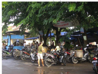
satu tenda digunakan bersama oleh beberapa pedagang