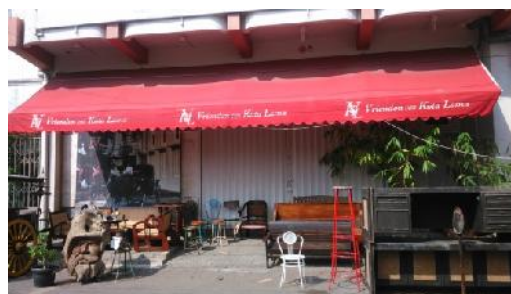
Gambar: Foto bangunan yang sedang dalam tahap renovasi

Berbeda dengan bangunan-bangunan lainnya yang berkembang dikawasan kota lama, bangunan ini merupakan bangunan yang berfungsi menjadi toko barang antik, tidak hanya memanfaatkan dalam bangunan saja, namun teras depan bangunan juga dimanfaatkan untuk menjual barang-barang yang ditawarkan. Bangunan ini tidak mengalami perubahan bentuk bangunan, lantai, dinding maupun plafon.