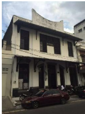
Gambar: Bangunan Hero Cafe

memberdayakan penduduk sekitar sekaligus menyelesaikan masalah parkir yang tidak tersedia di sekitar Jalan Kepodang.