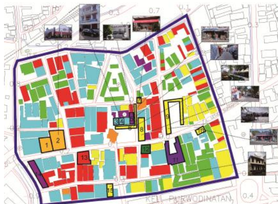
Gambar : Peta tata guna lahan kawasan kota lama th 2016

Dari tahun 2015 ke tahun 2016 ternyata banyak perubahan yang terjadi pada kawasan kota lama Semarang, bangunan-bangunan komersil, perdagangan, lahan terbuka, dan café berkembang di kawasan ini. Beberapa bangunan yang mengalami perubahan secara fisik dan fungsi guna bangunan. Beberapa fungsi guna bangunan berubah menjadi fungsi komersil. Dapat dilihat pada peta dibawah ini.