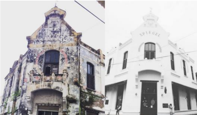
gambar: Kondisi Spiegel sebelum dan sesudah direnovasi pada tahun 2015

Spiegel merupakan salah satu bangunan yang cukup menarik di Kawasan Kota Lama Semarang. Bangunan yang cukup iconik dengan balkon dan tulisan SPIEGEL pada fasad ini terletak di Jalan Letjen Suprpto No.34 Semarang. Spiegel dibangun pada tahun 1895 dan dahulu merupakan toko serba ada yang menjual kebutuhan sehari-hari, peralatan ruma tangga, mesin ketik, dan lain-lain. Sejak 8 Juni 2015, Spiegel difungsikan kembali menjadi cafe setelah melalui renovasi.