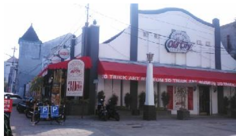
Gambar : Bangunan 3D Trick Art Museum

3D Trick Art Museum merupakan salah satu lokasi wisata baru di Kawasan Kota Lama Semarang. Di dalamnya terdapat lukisan-lukisan dan instalasi seni yang tampak nyata saat di foto. Objek wisata ini baru saja dibuka pada Mei 2016 lalu. Selain lukisan dan instalasi seni, di bangunan ini juga dibuat cafe untuk mengakomodir kebutuhan pengunjung.