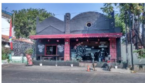
Gambar: Bangunan Cafe 57 di Jalan Letjen Suprpto

Bangunan café 57 ini merupakan bangunan yang baru mengalami perubahan fungsi guna bangunan, yang tadinya merupakan sebuah fungsi garasi mobil berubah menjadi café yang sangat menarik. Beberapa perubahan yang dilakukan adalah merubah lantai dan plafon, yang dipertahankan hanyalah dinding, karena pada bangunan ini mengutamakan penggunaan perabot dan memaksimalkan penggunaan cat untuk membuat bangunan ini menjadi lebih menarik. Bangunan ini berkembang pada tahun 2016, hal ini dinilai sebagai follower café-café sebelumnya yang mulai berkembang dikawasan ini.