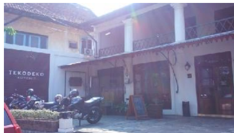
Gambar : Bangunan Cafe Tekodeko