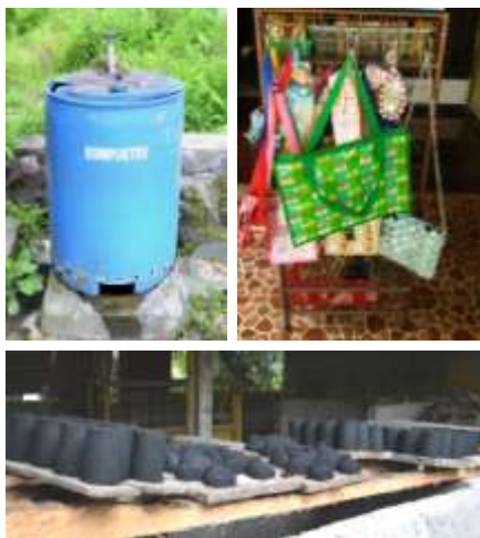
Gambar 7. Komposter-kerajinan daur ulang kemasan-arang

Warga Kampung Sukunan hanya mengolah sampah organik (yang kemudian akan diolah menjadi kompos dan atau arang) dan sampah anorganik yang berupa kemasan (jenis sampah plastik tebal baik yang berlapis aluminium foil maupun tidak berlapis) untuk kemudian didaur ulang menjadi kerajinan tangan seperti tas, dompet, dll.