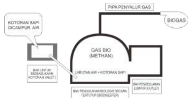
Gambar 9. Instalasi Biogas Kampung Sukunan

Dari gambar 8 di atas, tampak bahwa pengelolaan sampah di Kampung Sukunan telah tersistem dengan baik, mulai dari pengelolaan sampah di tingkat masing-masing rumah tangga hingga tingkat Kampung yang membawahi 5 RT. Pengelolaan sampah yang dilakukan tidak hanya mencakup 3R (reduce, reuse, recycle) atau pengurangan, penggunaan kembali dan daur ulang, namun juga recovery / pemulihan yang tampak dari pengolahan limbah cair dengan menggunakan IPAL, sehingga limbah cair rumah tangga yang kurang bersahabat dengan lingkungan dapat diolah terlebih dahulu untuk kemudian menjadi aman bagi lingkungan sebelum dialirkan kembali ke alam; penggunaan sampah padat yang tidak berbahaya seperti sisa bahan bangunan dll sebagai bahan urugan tanah; serta perubahan energi / energy conversion berupa biogas yang mengubah sampah berupa kotoran ternak menjadi energi panas / api (dapat dilihat di Gambar 9).