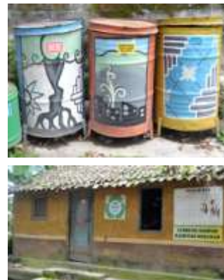
Gambar 10. Seni mural pada sarana & prasarana pengelolaan sampah di Sukunan

Selain Pelaporan Hasil Penjualan Sampah yang terpampang di Lumbung Sampah, kegiatan pengelolaan sampah di Kampung Sukunan juga rutin dilaporkan dalam forum pertemuan warga setiap sebulan sekali.