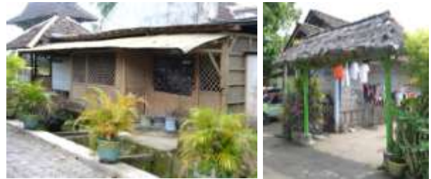
Gambar 12. Balai Serba Guna – Gapura Jalan

keterampilan yang telah mereka miliki dan mereka terapkan dalam kehidupan sehari-hari.