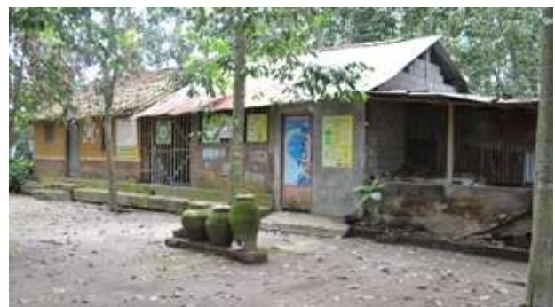
Gambar 5. Lumbung Sampah / TPS Kampung Sukunan.

Tempat Penampungan Sampah (TPS) Kampung oleh Petugas. Biaya operasional petugas di sini akan diambil dari hasil penjualan sampah oleh pengepul sampah / lapak (rekanan). Sedangkan untuk sampah B3 akan menjadi tanggung jawab pemerintah maupun pemerintah daerah.