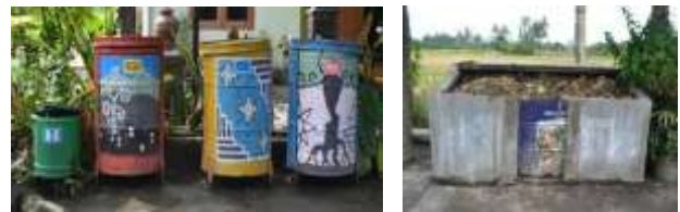
Gambar 4. Bak Pemilahan Sampah pada Kampung Sukunan