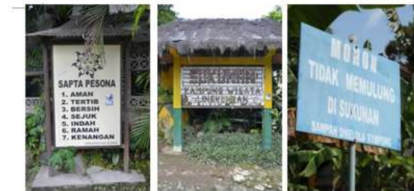
Gambar 3. Papan Tanda di Kampung Sukunan

Pemilihan sistem pengelolaan sampah swakelola di Kampung Sukunan bertujuan untuk menangani permasalahan sampah secara mandiri oleh masyarakat, oleh karena itu pemulung tidak diijinkan masuk di lingkungan Kampung Sukunan. Dengan adanya sistem tersebut diharapkan akan tumbuh kesadaran masyarakat dalam menjaga lingkungan dan memperkuat rasa kepemilikan akan Kampung Sukunan sehingga warga akan lebih memberikan perhatian penuh terhadap kebersihan dan keindahan lingkungan tempat tinggal mereka.