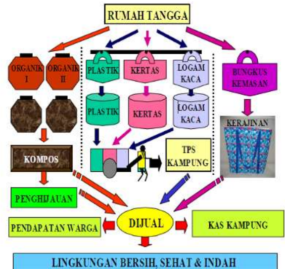
Gambar 8. Bagan Pengelolaan Sampah Kampung Sukunan

tangga akan melalui proses IPAL (instalasi pengolahan air limbah) sebelum kemudian kembali dialirkan menuju sungai / untuk mengairi lahan pertanian.