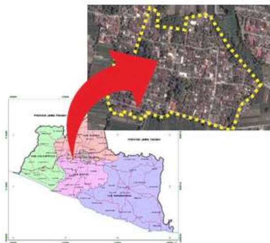
Gambar 2. Lokasi Kampung Sukunan

Menurut Ife dalam Aryenti (2011), pemberdayaan masyarakat adalah suatu konsep peningkatan kualitas masyarakat sehingga masyarakat tersebut dapat menentukan masa depannya sendiri sesuai dengan sumber daya, kesempatan, keterampilan dan pengetahuan yang mereka miliki. Masyarakat adalah penghasil utama sampah, oleh sebab itu masyarakat harus bertanggung jawab terhadap sampah yang dihasilkan tersebut.