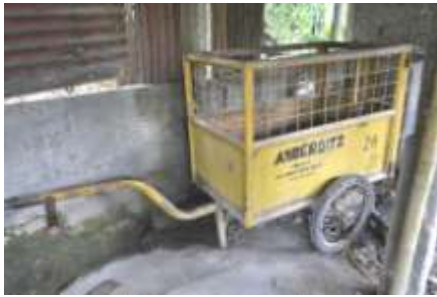
Gambar 6. Gerobag sampah sebagai alat angkut menuju TPS

Gerobag sampah di atas merupakan hasil sumbangan dari Pemerintah Kab. Sleman. Namun pengadaan gerobag sampah tersebut ada setelah sistem pengelolaan sampah swakelola di Kampung Sukunan telah berjalan dengan baik, dengan kata lain respon dari Pemerintah baru ada setelah program tersebut terbukti dapat berjalan dan sukses.