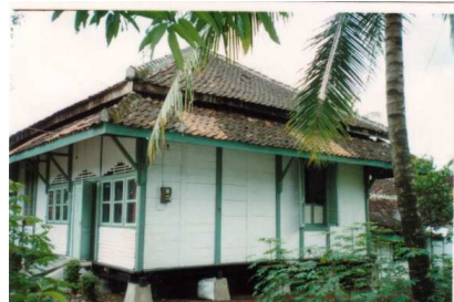
Gambar 1. Fasade depan rumah panggung di Kedungjati Grobogan