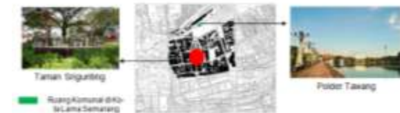
Gambar 2 Lokasi studi kasus

Ruang komunal yang menjadi objek penelitian adalah Taman Srigunting dan Polder Tawang. Keduanya merupakan ruang komunal yang terkenal di Kota Lama Semarang dan banyak dikunjungi masyarakat baik domestik maupun turis mancanegara.