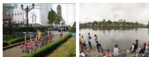
Gambar 1 Kondisi Eksisting studi kasus

ini berubah bentuk menjadi taman. Selain itu, tidak hanya sekedar taman, tetapi juga saat ini di taman yang dikenal sebagai Taman Srigunting ini juga seringkali digunakan oleh pedagang kaki lima untuk berjualan dan juga sering digunakan sebagai lahan parkir bagi pengunjung taman ini. Selain itu, saat ini taman ini juga sering digunakan oleh masyarakat maupun komunitas tertentu untuk saling berinteraksi sosial.