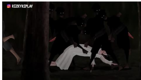
Figur 1. Sundari dikepung oleh sekelompok pria

dikepung oleh sekelompok laki-laki menghadirkan ketidakberdayaan korban dalam relasi kuasa patriarki. Kondisi pasca-kekerasan, seperti pakaian robek, tidak secara langsung menunjukkan bahwa ia “sundel”, tetapi secara simbolis merepresentasikan stereotip perempuan yang dianggap “tidak bermoral”, terutama melalui tubuh terbuka yang diposisikan sebagai objek bagi laki-laki. Label “sundel” mulai dilekatkan oleh Barno setelah ia merasa dikhianati, sehingga pelabelan tersebut berangkat dari emosi yang subjektif. Namun, kondisi fisik Sundari setelah kekerasan seolah mengukuhkan label tersebut, sehingga pengalaman kekerasan justru dikaitkan dengan penilaian moral dan menunjukkan objektifikasi terhadap perempuan.