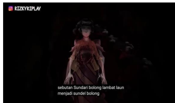
Figur 5. Perubahan penamaan “Sundari” menjadi “Sundel Bolong”

Sementara itu, dalam dimensi praktik diskursif, video ini memperlihatkan bagaimana media baru bekerja secara sistematis untuk membawa mitos tradisional ke dalam ruang digital. Kanal Rizky Riplay melakukan proses alih wahana dengan mengubah cerita rakyat menjadi konten animasi horor yang terstruktur. Dalam proses ini, sosok Sundel Bolong tidak lagi hanya menjadi teror lisan, melainkan diolah menjadi komoditas visual yang menggabungkan unsur sejarah, seperti sistem kerja paksa blandong dan pengawasan hutan oleh sinder pada masa kolonial. Kreator juga memanfaatkan pola operasional platform dengan menyelipkan ajakan berlangganan ( subscribe ) di awal video guna menjamin keberlangsungan produksi melalui dukungan audiens.