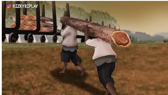
Figur 7. Para blandong (penebang kayu) yang dipaksa bekerja rodi