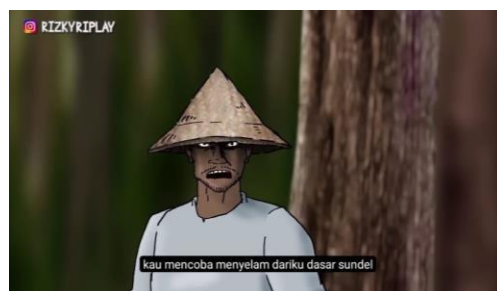
Figur 3. Pelabelan “Sundel” yang dilekatkan pada Sundari

Identitas supranatural Sundari kemudian dipermanenkan setelah kematiannya melalui visualisasi darah di sekujur tubuh dan punggung yang bolong. Secara linguistik, perubahan penamaan dari “Sundari” menjadi “Sundel Bolong” menunjukkan praktik objektifikasi, karena identitasnya sebagai korban kekerasan dihapus dan digantikan oleh citra horor yang menonjolkan tubuh yang rusak. Penderitaan manusiawi yang dialaminya, seperti kekerasan,