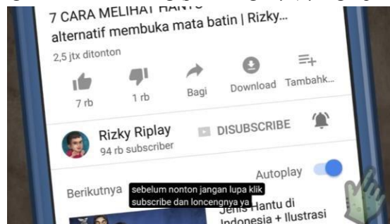
Figur 8. Ajakan untuk berlangganan (subscribe) oleh kreator

Penyebaran konten ini sangat mengandalkan mekanisme algoritma YouTube yang menggunakan label spesifik seperti “Animasi Horor” dan “Hantu Sundel Bolong” untuk menjangkau penonton dalam skala besar. Dari sisi konsumsi, teks visual ini diterima oleh jutaan orang yang kini memandang Sundel Bolong melalui sudut pandang hiburan digital modern. Transformasi ini membuktikan bahwa dalam praktik diskursif media masa kini, sebuah mitos lama diproduksi ulang secara profesional, disebarkan menggunakan teknologi berbasis data, dan dinikmati masyarakat sebagai sarana rekreasi. Meski dikemas sebagai hiburan, konten tersebut tetap menyampaikan pesan moral yang kuat mengenai penderitaan perempuan dan ketidakadilan di masa lalu.