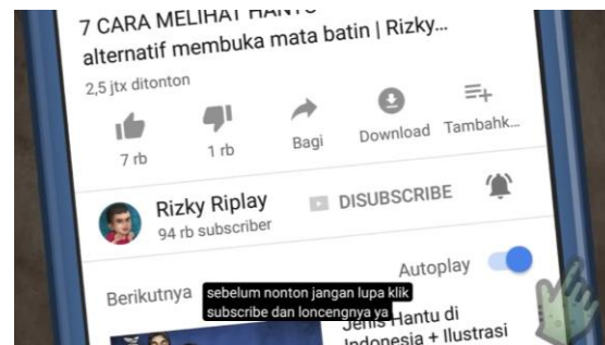
Figur 8. Ajakan untuk berlangganan (subscribe) oleh kreator

Penyebaran konten ini sangat mengandalkan mekanisme algoritma YouTube yang menggunakan label spesifik seperti “Animasi Horor” dan “Hantu Sundel Bolong” untuk menjangkau penonton dalam skala besar. Dari sisi konsumsi, teks visual ini diterima oleh jutaan orang yang kini memandangi Sundel Bolong melalui sudut pandang hiburan digital modern. Transformasi ini membuktikan bahwa dalam praktik diskursif media masa kini, sebuah mitos lama diproduksi ulang secara profesional, disebarkan menggunakan teknologi berbasis data, dan dinikmati masyarakat sebagai sarana rekreasi. Meski dikemas sebagai hiburan, konten tersebut tetap menyampaikan pesan moral yang kuat mengenai penderitaan perempuan dan ketidakadilan di masa lalu.