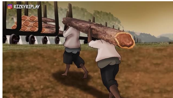
Figur 7. Para blandong (penebang kayu) yang dipaksa bekerja rodi