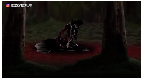
Figur 4. Sundari tersungkur bersimbah darah dengan punggung berlubang setelah dibunuh

trauma, dan ketidakadilan, direduksi menjadi sekadar elemen visual untuk menimbulkan rasa takut. Visualitas luka yang ekstrem ini mengonfirmasi label hinaan verbal menjadi identitas permanen dalam ingatan kolektif masyarakat. Dengan demikian, teks video ini tidak hanya menyajikan horor, tetapi juga menunjukkan bagaimana stigma dan trauma seorang perempuan diproduksi ulang menjadi simbol kengerian yang memisahkan dirinya dari konteks sosial-historis sebagai korban kejahatan yang seharusnya mendapatkan simpati.