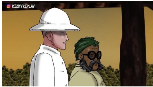
Figur 6. Pengawasan hutan jati milik pihak kompeni oleh sinder