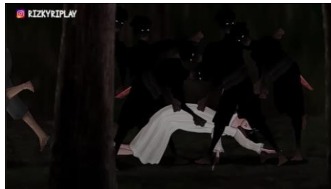
Figur 1. Sundari dikepung oleh sekelompok pria

dikepung oleh sekelompok laki-laki menghadirkan ketidakberdayaan korban dalam relasi kuasa patriarki. Kondisi pasca-kekerasan, seperti pakaian robek, tidak secara langsung menunjukkan bahwa ia “sundel”, tetapi secara simbolis merepresentasikan stereotip perempuan yang dianggap “tidak bermoral”, terutama melalui tubuh terbuka yang diposisikan sebagai objek bagi laki-laki. Label “sundel” mulai dilekatkan oleh Barno setelah ia merasa dikhianati, sehingga pelabelan tersebut berangkat dari emosi yang subjektif. Namun, kondisi fisik Sundari setelah kekerasan seolah mengukuhkan label tersebut, sehingga pengalaman kekerasan justru dikaitkan dengan penilaian moral dan menunjukkan objektifikasi terhadap perempuan.