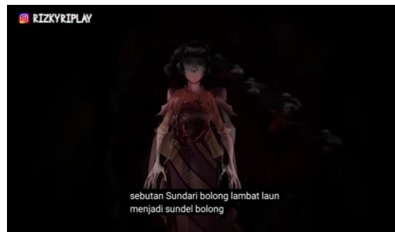
Figur 5. Perubahan penamaan “Sundari” menjadi “Sundel Bolong”

Sementara itu, dalam dimensi praktik diskursif, video ini memperlihatkan bagaimana media baru bekerja secara sistematis untuk membawa mitos tradisional ke dalam ruang digital. Kanal Rizky Riplay melakukan proses alih wahana dengan mengubah cerita rakyat menjadi konten animasi horor yang terstruktur. Dalam proses ini, sosok Sundel Bolong tidak lagi hanya menjadi teror lisan, melainkan diolah menjadi komoditas visual yang menggabungkan unsur sejarah, seperti sistem kerja paksa blandong dan pengawasan hutan oleh sinder pada masa kolonial. Kreator juga memanfaatkan pola operasional platform dengan menyelipkan ajakan berlangganan ( subscribe ) di awal video guna menjamin keberlangsungan produksi melalui dukungan audiens.