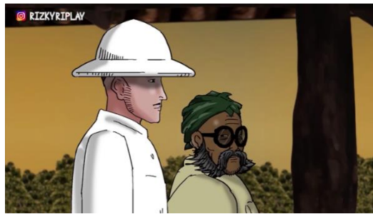
Figur 6. Pengawasan hutan jati milik pihak kompeni oleh sinder