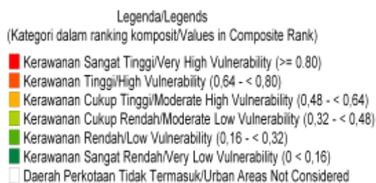
Gambar 1 Peta Kerawanan Pangan Jawa Tengah Tahun 2008

Penyebab utama terjadinya kerawanan pangan di Jawa Tengah adalah persentase penduduk miskin, persentase rumah tangga yang tidak memiliki akses terhadap listrik serta akses jalan yang memadai. Dengan demikian kerawanan pangan yang terjadi di Provinsi Jawa Tengah bukan disebabkan ketersediaan pangan yang tidak memadai.