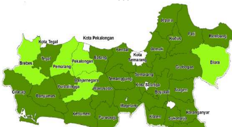
Gambar 2 Peta Ketahanan dan Kerentanan Pangan (FSVA) Provinsi Jawa Tengah Tahun 2009

Hasil penyusunan data base peta ketahanan dan kerentanan pangan Jawa Tengah tahun 2010 secara umum kondisi ketahanan dan kerentanan pangan Jawa Tengah lebih baik dibandingkan tahun sebelumnya. Hal ini tercermin dari 28 kabupaten sangat tahan pangan (hijau tua) dan 1 kabupaten (Brebes) dalam kondisi tahan pangan yang di dalam peta ditandai berwarna hijau muda. Empat kabupaten yang tahun 2009 berstatus hijau muda telah meningkat menjadi hijau tua yaitu kabupaten Pekalongan, Pemalang, Blora dan Banjarnegara.