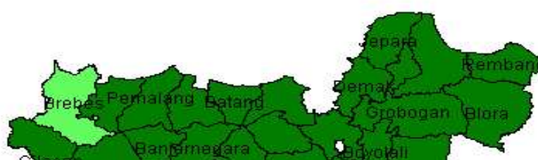
Gambar 3 Peta Ketahanan dan Kerentanan Pangan Jawa Tengah Tahun 2010 fersi Food Security and Vulnerability Atlas (FSVA) 2010

Hasil penyusunan data base peta ketahanan dan kerentanan pangan Jawa Tengah tahun 2010 secara umum kondisi ketahanan dan kerentanan pangan Jawa Tengah lebih baik dibandingkan tahun sebelumnya. Hal ini tercermin dari 28 kabupaten sangat tahan pangan (hijau tua) dan 1 kabupaten (Brebes) dalam kondisi tahan pangan yang di dalam peta ditandai berwarna hijau muda. Empat kabupaten yang tahun 2009 berstatus hijau muda telah meningkat menjadi hijau tua yaitu kabupaten Pekalongan, Pemalang, Blora dan Banjarnegara.