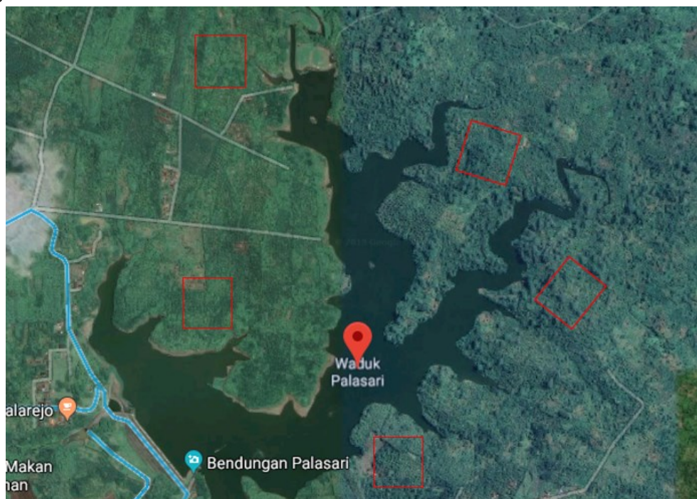
Gambar 1. Bentuk Waduk Palasari dan pembagian zona penelitian

Kawasan sabuk hijau Waduk Palasari merupakan kawasan yang terletak disepanjang bantaran Waduk Palasari yang berbatasan langsung dengan Hutan Palasari dan beberapa permukiman warga Desa Tukadaya. Vegetasi yang mendominasi kawasan sabuk hijau tersebut yaitu, tanaman kayu produksi dan tanaman perkebunan. Kawasan sabuk hijau Waduk Palasari yang menjadi lokasi observasi digambarkan seperti pada gambar 1.