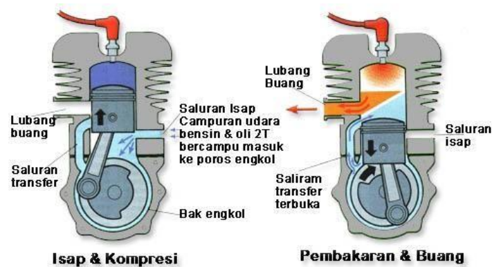
Gambar 1. Roda Gigi [?].

Penampilan gambar tidak ada aturan baku namun intinya harus jelas dan terbaca, tidak terlalu besar dan tidak terlalu kecil. Setiap menampilkan gambar harus ada rujukan di bagian narasi misal "...lebih jelas dapat dilihat pada Gambar 1". Judul Gambar diletakan di tengah bawah gambar.