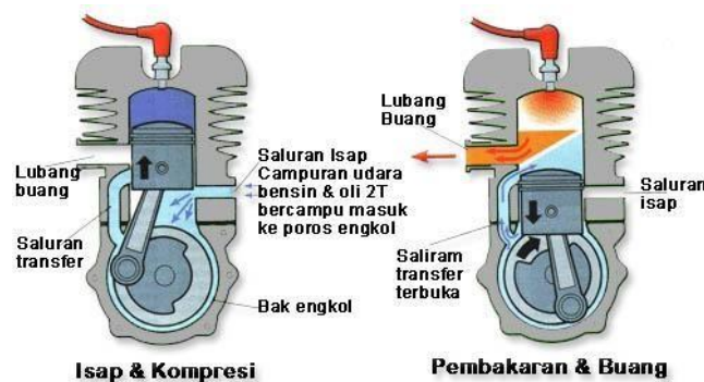
Gambar 1. Sistem pembakaran 2 langkah [no referensi]

Penampilan judul gambar di bagian bawah gambar dan rata tengah. Format penulisan adalah “ Gambar 1. Judul gambar”. Judul Setiap menampilkan gambar harus ada rujukan di bagian narasi misal “...lebih jelas dapat dilihat pada Gambar 1”. Gambar harus dapat dibaca dengan mudah; tanpa garis tepi; diformat dalam bentuk tiff dengan ukuran minimal 300 dpi..