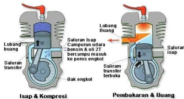
Gambar 1. Sistem pembakaran 2 langkah [no referensi]

Penampilan judul gambar di bagian bawah gambar dan rata tengah. Format penulisan adalah “ Gambar 1. Judul gambar”. Judul Setiap menampilkan gambar harus ada rujukan di bagian narasi misal “...lebih jelas dapat dilihat pada Gambar 1”. Gambar harus dapat dibaca dengan mudah; tanpa garis tepi; diformat dalam bentuk tiff dengan ukuran minimal 300 dpi..