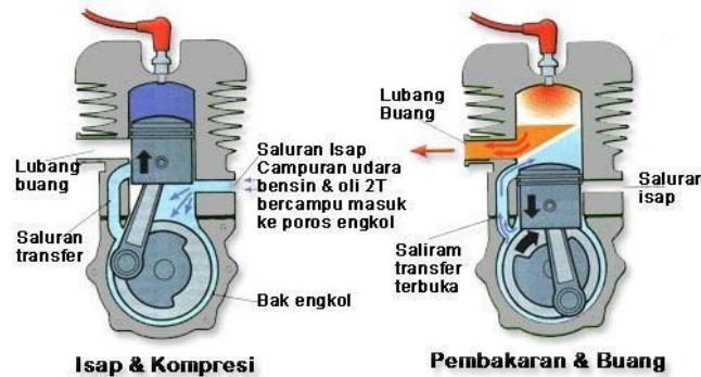
Gambar 1. Sistem pembakaran 2 langkah [no referensi]

Penampilan judul gambar di bagian bawah gambar dan rata tengah. Format penulisan adalah “ Gambar 1. Judul gambar”. Judul Setiap menampilkan gambar harus ada rujukan di bagian narasi misal “...lebih jelas dapat dilihat pada Gambar 1”. Gambar harus dapat dibaca dengan mudah; tanpa garis tepi; diformat dalam bentuk tiff dengan ukuran minimal 300 dpi..