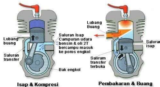
Gambar 1. Sistem pembakaran 2 langkah [no referensi]

Penampilan judul gambar di bagian bawah gambar dan rata tengah. Format penulisan adalah “ Gambar 1. Judul gambar”. Judul Setiap menampilkan gambar harus ada rujukan di bagian narasi misal “...lebih jelas dapat dilihat pada Gambar 1”. Gambar harus dapat dibaca dengan mudah; tanpa garis tepi; diformat dalam bentuk tiff dengan ukuran minimal 300 dpi..