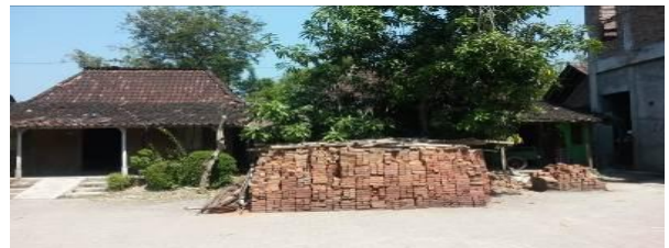
Gambar 3. Permukiman tak terencana.