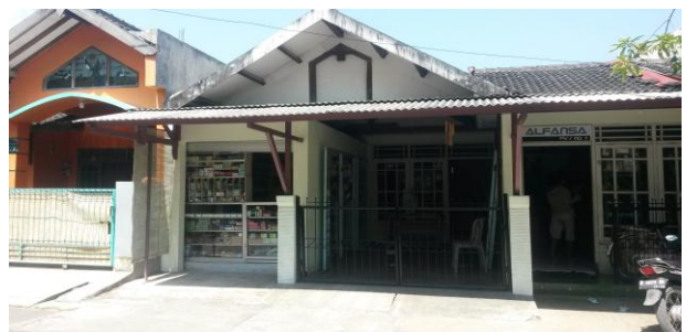
Gambar 2. Permukiman terencana.

Kelurahan Sendang Mulyo memiliki tiga karakteristik permukiman, yaitu: (1) permukiman terencana (Gambar 2), meliputi perumahan Klipang Green, Perum Klipang, dan Perum Megantara, (2) permukiman tidak terencana (Gambar 3) yaitu Kampung Pekuncen, dan (3) permukiman otonom (Gambar 4) di sepanjang Jl. Raya Klipang Golf. Peta ketiga karakteristik permukiman di Sendang Mulyo ditampilkan pada Gambar 5.