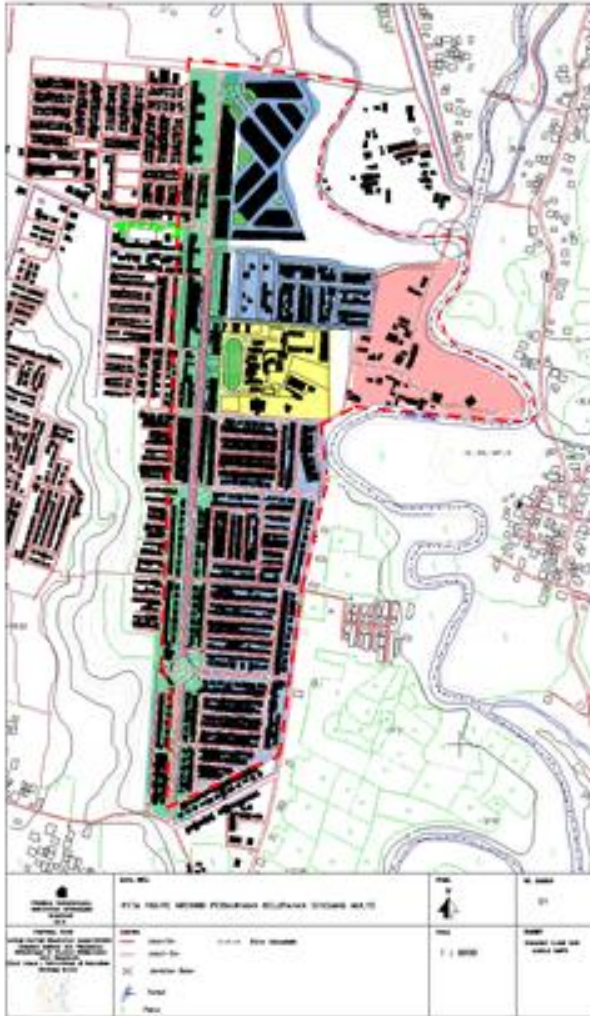
Gambar 2. Karakteristik permukiman di Kelurahan Sendang Mulyo.