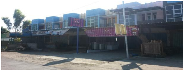
Gambar 5. Permukiman otonom) (Sumber: Analisa penulis, 2016).