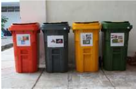
Gambar 2. Empat wadah sampah di Lokasi Percontohan

bisa lagi diupayakan untuk reuse dan recycle sehingga akan masuk ke dalam TPA, dan warna merah untuk sampah botol minuman.