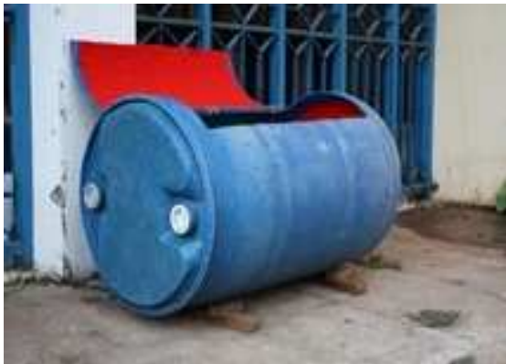
Gambar 3. Modified Takakura

Selain itu disediakan pula sebuah keranjang Takakura sehingga sampah organik yang telah terkumpul dari tempat sampah warna hijau dapat segera diolah secara biologi yaitu dengan keranjang Takakura. Sampah kertas dan sampah botol dapat ditingkatkan nilainya karena tidak lagi masuk ke TPA melainkan ditukar dengan rupiah lewat pemulung.