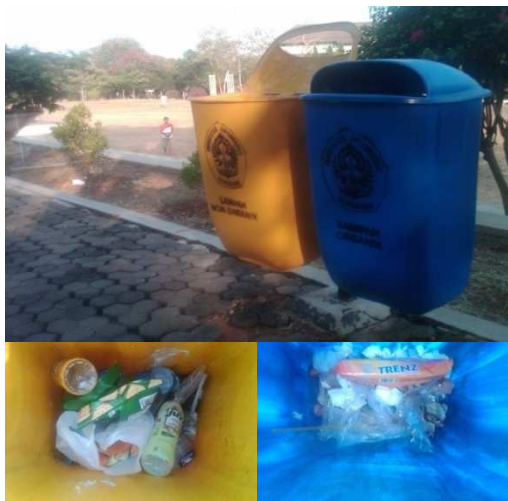
Gambar 1. Wadah sampah di WP

Berdasarkan survey yang telah dilakukan didapatkan kondisi eksisting pewardahan sampah yang masih berbeda antar-fakultas dan antar-jurusan. Terdapat beberapa fakultas yang telah menyediakan dua (2) jenis wadah sampah yaitu organik dan anorganik, misalnya Fakultas Sains dan Matematika (FSM), Fakultas Ekonomi, dan beberapa jurusan di Fakultas Teknik, misalnya saja jurusan Teknik Lingkungan dan Teknik Kimia. Dari beberapa lokasi dilakukannya pengamatan awal, wadah berada dalam kondisi yang cukup baik. Dari sisi bentuk, wadah berbentuk bin, kotak atau silinder dan memiliki tutup. Bahannya terbuat dari logam, plastik dan fiberglass. Wadah sampah ini disediakan oleh pengelola jurusan / program studi. Untuk fakultas yang tidak memiliki jurusan, wadah sampah disediakan oleh pengelola fakultas. Wadah – wadah tersebut secara umum mudah dikosongkan dan telah disediakan untuk dua jenis sampah yaitu organik dan anorganik.